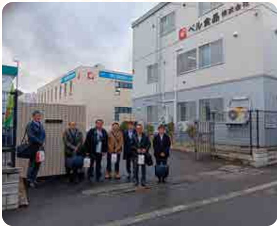
ベル食品株式会社にて

最後にベル食品では「てん菜由来の砂糖の甘味は、うまみのベース」としており、今後もてん菜および製品砂糖の安定供給を求められ、「絶対に欠かせない素材」ですので、栽培し続けて下さい」とエールを頂きました。