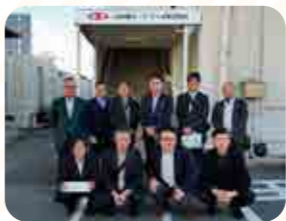
JA全農ミートフーズ株

生産現場では、全国の和牛生産頭数は増加傾向ながら頭打ち感があり、ホルスタイン雄は平成24年の約24万頭をピークに減少し、令和7年には11万頭以下と予測されています。特に北海道以外での酪農の縮小が顕著で、国内の乳製品・牛肉生産基盤が北海道偏重になりつつあります。世界的にはアメリカが牛肉の生産・消費・輸入で最大ですが、近年アメリカの生産量の減少によりオーストラリアからの輸入が増加し、世界的に牛肉は不足気味です。また、円安の影響で輸入牛肉価格が高騰し国産牛肉の流通が増えており、特にホルスタイン雄の赤身牛肉の評価が高まっています。