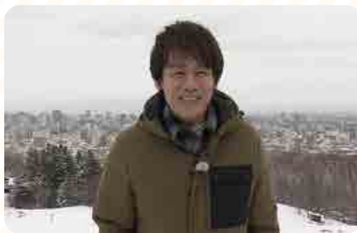
森崎博之氏からの特別メッセージ (メッセージビデオ画面より)