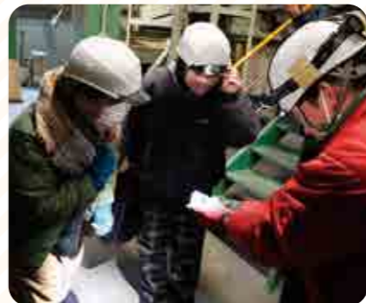
調整後の小豆を熱心に確認しました