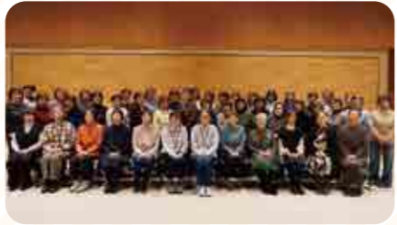
研修会にて集合写真

2日目は、ホテル宴会場での映画鑑賞後、昼食を食べてからの解散となり、ゆっくりと温泉を楽しみつつ支部を超えて親睦を深めていただくことが出来た研修会・交流会となりました。