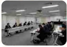
熊本県酪農協同組合連合会

同連合会に隣接している乳業工場(らくのうまザース)熊本工場は昭和49年に操業を開始し、厳格な衛生管理と最新設備による牛乳製造が行われています。牛乳・加工乳・発酵乳・洋生菓子など多様な製品を製造し、複数の殺菌機や充填機、環境配慮型排水処理システムを導入し、安全・安心な製品づくりと品質管理を徹底しています。全体として、生産から出