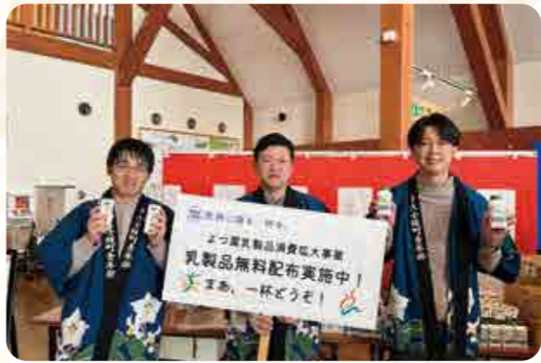
乳製品消費にご協力ください！

当日は、道の駅構内に青年部のブースを設け、来場者に乳製品の魅力や日常的な消費の大切さを呼びかけながら、よつ葉乳業の牛乳200mlおよび飲むヨーグルトの配布を行いました。会場は町内外の多くの来場者でにぎわい、足を止めて話を聞いてくださる方もおり、改めて乳製品への関心を高めていただくとともに、酪農や農業への理解を深めていただく良い機会となりました。 今後このような取り組みを継続し、乳製品の消費拡大と地域農業の発展に繋がることを期待しております。