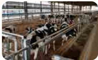
全酪連若齢預託熊本牧場

全酪連の預託事業は、酪農家の高齢化や後継者不足による戸数減少、生産基盤の縮小への対応策として、生後数日のホルスタイン種メス子牛を預かり、北海道へ上牧するまで育てることで酪農家の労力軽減や設備投資の削減を支援しています。会員農協を通じて都府県の酪農家と北海道の預託農家をつなぎ、課題解決に貢献しています。