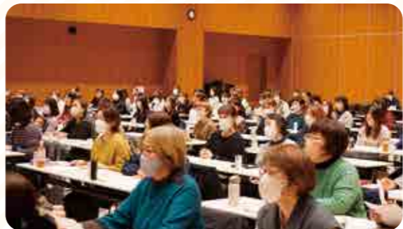
他JAの活動内容に聞き入る部員