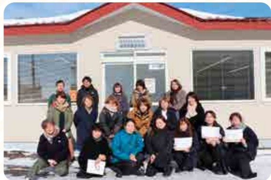
倉庫課事務所前にて

研修会終了後、農協会議室に場所を移し、Lunchica(ランチカ)によるケータリングを囲みながらの交流会となりました。土幌産食材の他にも各所に十勝産の食材をふんだんに生かしたコロダッチを使用したメニューに舌鼓をうち会話も弾む時間となりました。