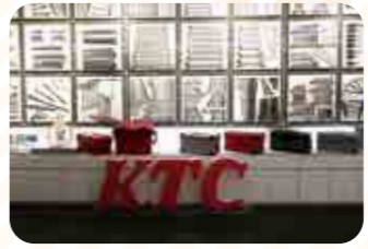
KTCものづくり技術館

KTCは京都機械工具(株)の略称で、京都府久世郡に本社を置く創業75周年を迎える老舗工具メーカーです。自動車や二輪車の整備用工具を中心に、医療・福祉・公共交通分野でも活躍し、モータースポーツやパラスポーツも支援しています。材料切断から梱包までの一貫生産体制を持つ日本唯一のメーカーで、約12,000点の製品を展開、1日約12万個を生産しています。安全性と使いやすさにこだわり、トヨタ自動車の車載工具にも採用されて