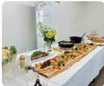
会議室が一変し素敵な会場となりました