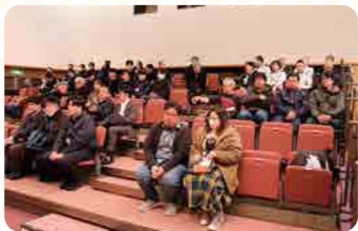
多くの方がご来場されました

本作品を通じて、北海道や士幌町の豊かな自然と農業を営む人々の情熱、そして食を通じて地域のつながりや誇りを改めて感じることができ、鑑賞された皆様も深く心を動かされる上映会となりました。