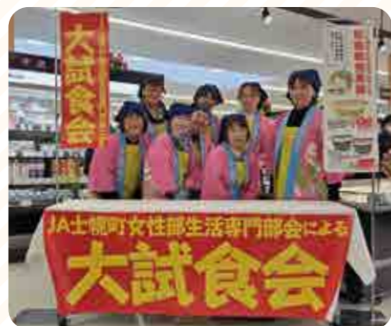
生活専門部会の皆さん、お疲れ様でした!