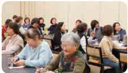
なかなかビンゴにならないな～