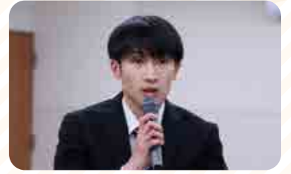
決意を新たにする塾生

また塾生からは、「今後20年、30年先の士幌町農業の根幹を担う世代が集い、研鑽を重ねていくことは大変意義深い。この塾で多くを学び、士幌町農業のさらなる発展に寄与できるよう努力していきたい」と力強い抱負が語られました。