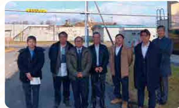
清水製糖工場 かしわ荘前にて