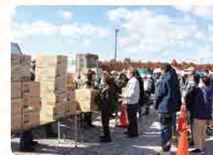
ポテトチップス販売