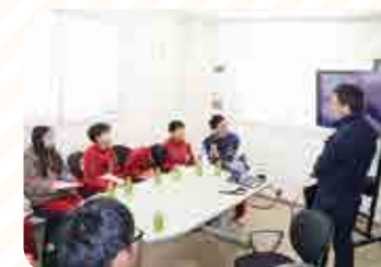
澱粉工場事務所での様子