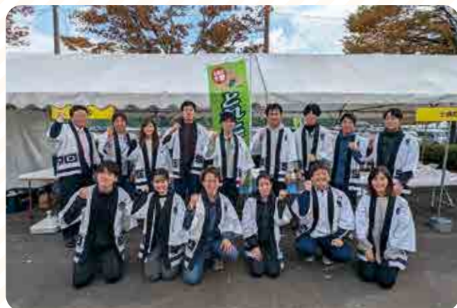
販売に従事された訪問団員と美濃市の方々