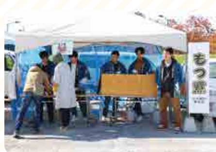
たくさんのお客様に購入いただきました