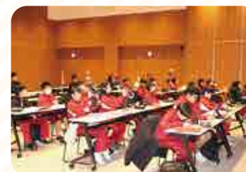
概要説明を聞く生徒

生徒からは、「最初に農協の概要を丁寧に説明してくださり、その後、工場や倉庫を実際に見学できたことで、農業や農協の仕事により興味を持ちました」などの感想が寄せられました。