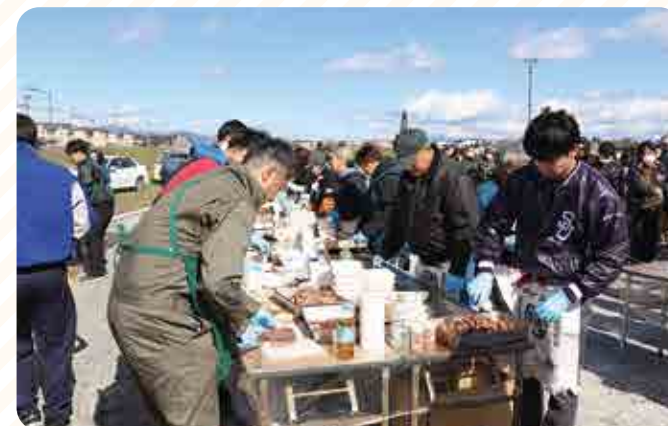
ステーキをカットするスタッフ