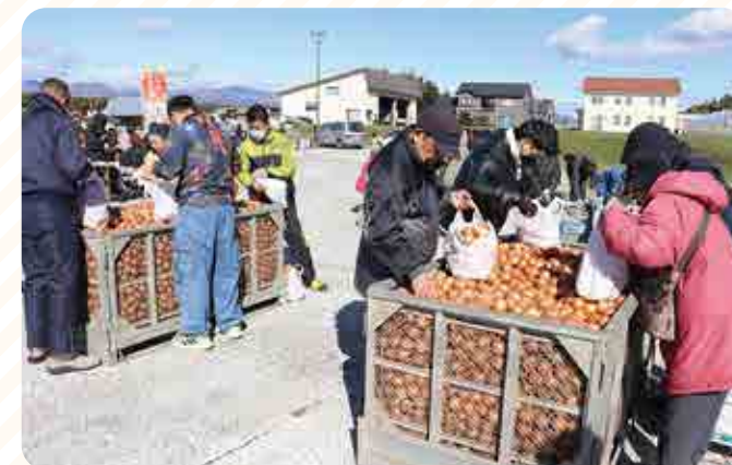
玉ねぎの袋詰め放題