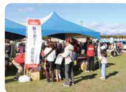
カルビークイズラリー