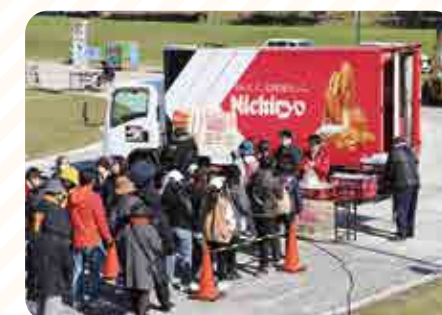
日糧製パンの無料配布