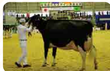
「サクランドドアマンロケットET」(第16部)