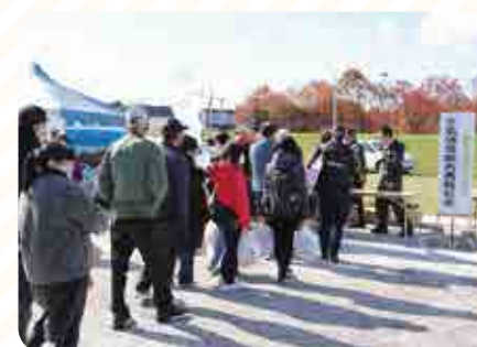
土幌酪農振興協議会による牛乳の無料配布