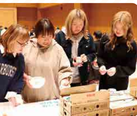
よつ葉商品に注目が集まる！

うどんなど多彩な料理が並び、参加者は食事を楽しみながら、互いの近況や情報交換を行い親睦を深めました。