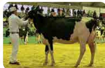
「サクランドラムダロエルET」号(第8部)