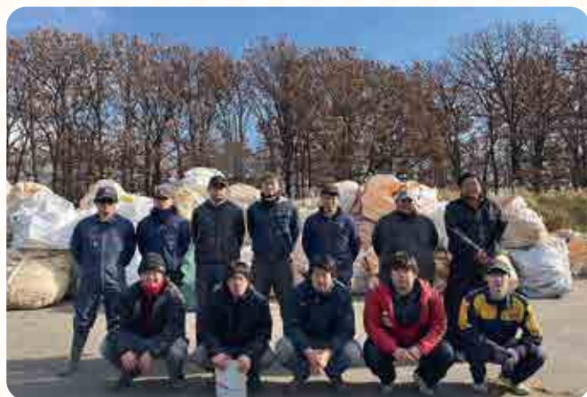
作業に従事した青年部員

うどんなど多彩な料理が並び、参加者は食事を楽しみながら、互いの近況や情報交換を行い親睦を深めました。