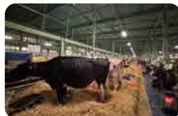
スタッフも夜通し見守ってます