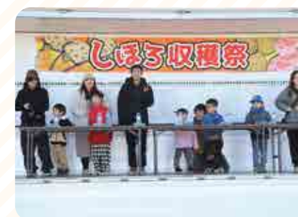
食べて重さピッタンコゲーム