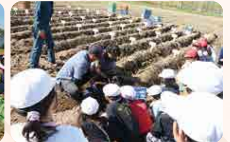
みんな夢中になって掘りました