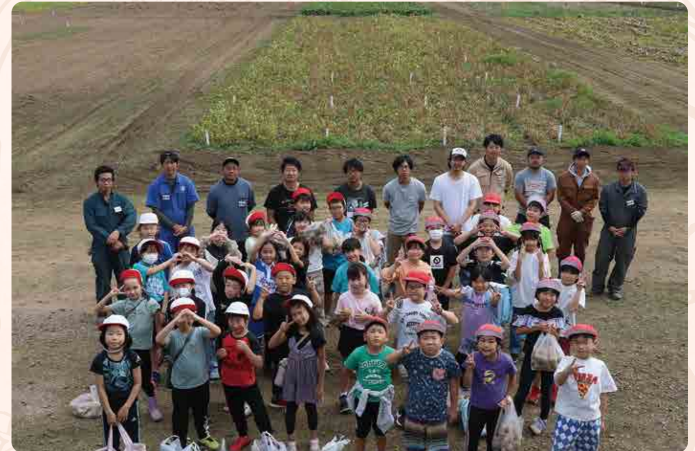
士幌小学校3年生の子供たちと青年部員で記念撮影!