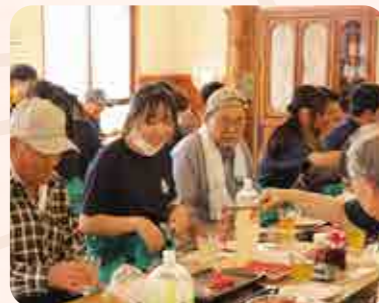
焼肉を囲んで色々な話を聞きました