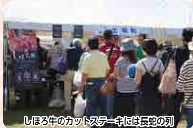
しほろ牛のカットステーキには長蛇の列

久しぶりの開催ということもあり多くの家族連れが訪れ、会場内では、搾乳の疑似体験、軽食の無料配布、ステージではよつ葉のコーポレートキャラクター「みるる」のショーなどが行われ、恒例となりました牛乳空パックとトイレットペーパーの交換会にも大勢のお客さんが交換に訪れました。 よつ葉乳業に出荷するJAによる特産品販売ブースは大変賑わい、当JAからは酪農振興協議会会員の協力を得てしほろ牛のカットステーキ約500食を販売しましたが、好評で長蛇の列ができ午前中に完売しました。