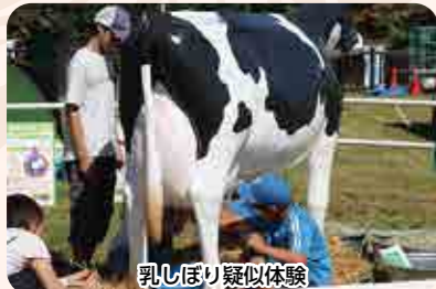
乳しほり疑似体験