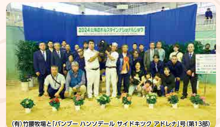
(有)竹腰牧場と「バンブー ハンソデール サイドキック アドレナ」号(第13部)