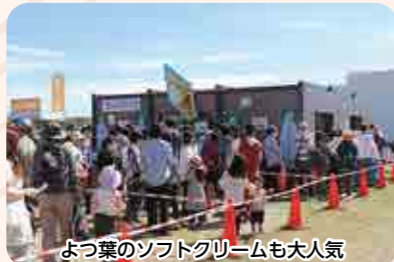
よつ葉のソフトクリームも大人気