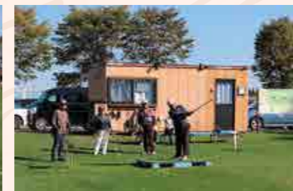
好プレーが続出しました!