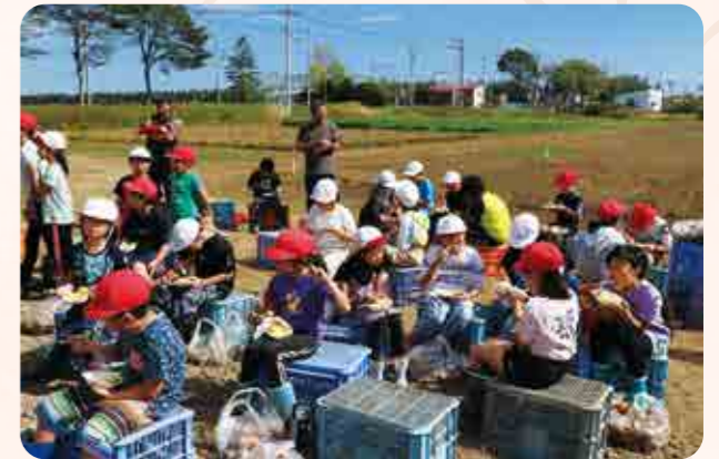
掘りたてのじゃがいもは美味しいね!

また、この時にとったアンケートでは「大きいじゃがいもをほれたり、じゃがバターがおいしかったです!!」「農業のことをたくさん教えてくれてありがとうございます。」などと感想が聞かれ、参加した子供たちが農業の魅力にふれ、食の大切さを楽しく学ぶことができた企画となりました。